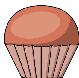
Muffin ou cupcake