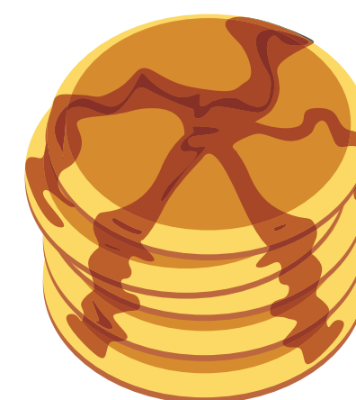
Pancake ou crêpe